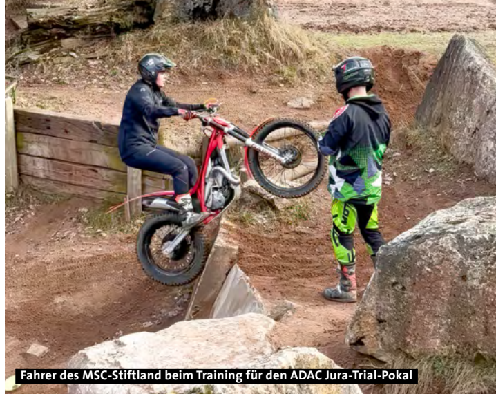
Fahrer des MSC-Stiftland beim Training für den ADAC Jura-Trial-Pokal