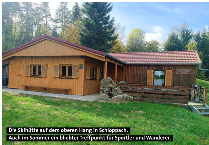
Die Skihütte auf dem oberen Hang in Schloppach. Auch im Sommer ein beliebter Treffpunkt für Sportler und Wanderer.

laden alle ein, bei Kaffee und Kuchen vorbeizukommen und sich auszutauschen.“