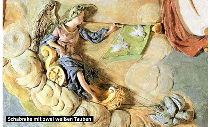
Schabracke mit zwei weißen Tauben