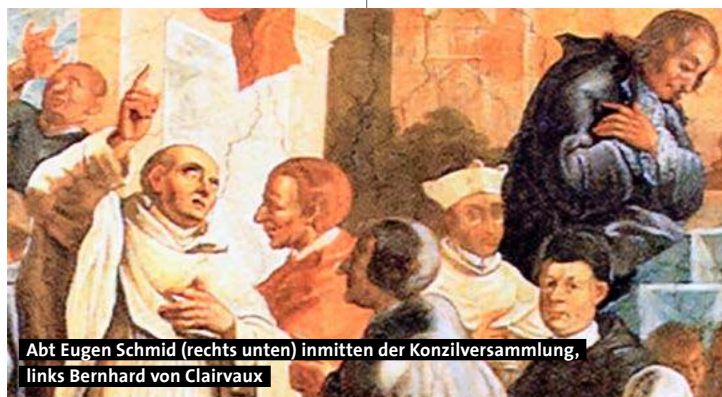
Abt Eugen Schmid (rechts unten) inmitten der Konzilversammlung, links Bernhard von Clairvaux

Ebenso werden die Verdienste des 1744 verstorbenen Abtes um die Bibliothek in der Leichenpredigt angeführt: Er „[e]rbauete eine sehr prächtige Welt-berühmte Bibliothec, in welcher die Kunst mit der Zierde, diese mit der unvergleichlichen Schönheit in der Wett streitet: