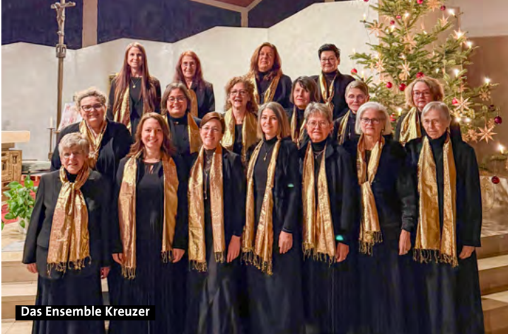
Das Ensemble Kreuzer