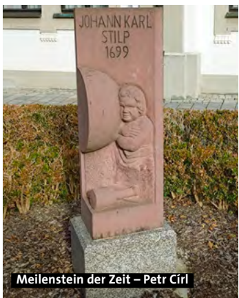
Meilenstein der Zeit – Petr Cirl

In Waldsassen erinnern zudem die Karl-Stilp-Straße an den 1735 in Eger verstorbenen Bildhauer sowie ein modernes Kunstwerk vor dem kath. Pfarramt.