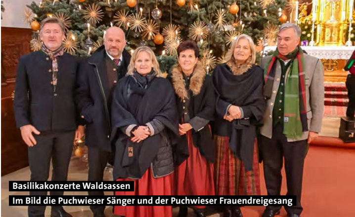
Basilikakonzerte Waldsassen Im Bild die Puchwieser Sänger und der Puchwieser Frauendreiesang