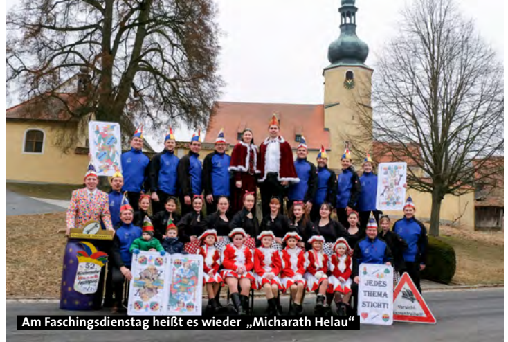
Am Faschingsdienstag heißt es wieder „Micharath Helau“

Öffnungszeiten: direkt vor der Türe: P Mo-Fr: 9.00-18.00 h www.koffer-shop.de Sa: 9.30-12.30 h h.schmidt@bermas.net