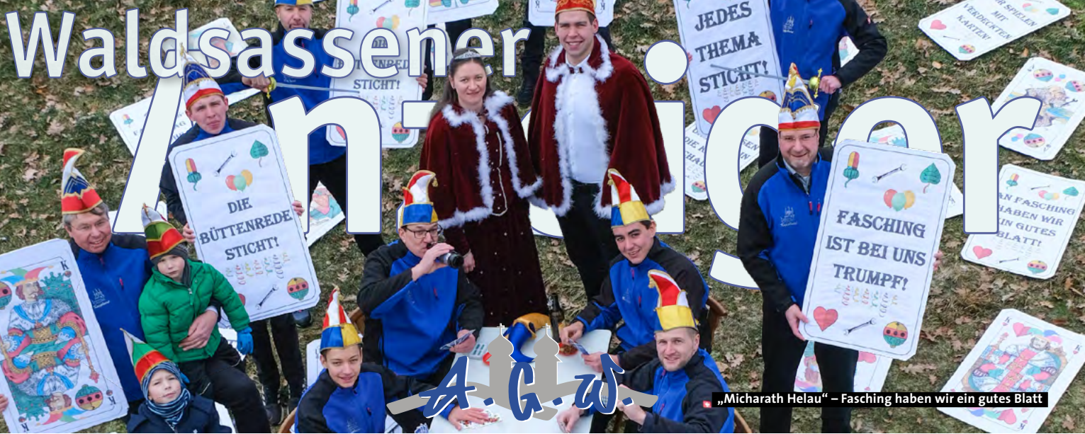
„Micharath Helau“ – Fasching haben wir ein gutes Blatt