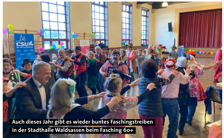
Auch dieses Jahr gibt es wieder buntes Faschingstreiben in der Stadthalle Waldsassen beim Fasching 60+