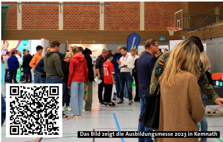
Das Bild zeigt die Ausbildungsmesse 2023 in Kennath