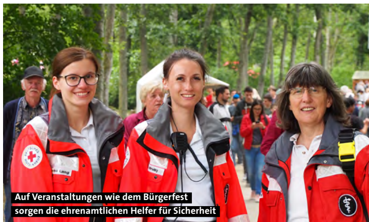
Auf Veranstaltungen wie dem Bürgerfest sorgen die ehrenamtlichen Helfer für Sicherheit

„Wir hoffen auf einen regen Besuch aus der Bevölkerung Waldsassens und dass sie gemeinsam mit ihrem Roten Kreuz feiern. Denn sonst sieht man sich ja leider oft nur zu unschönen Anlässen.“