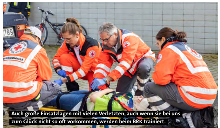
Auch große Einsatzlagen mit vielen Verletzten, auch wenn sie bei uns zum Glück nicht so oft vorkommen, werden beim BRK trainiert.